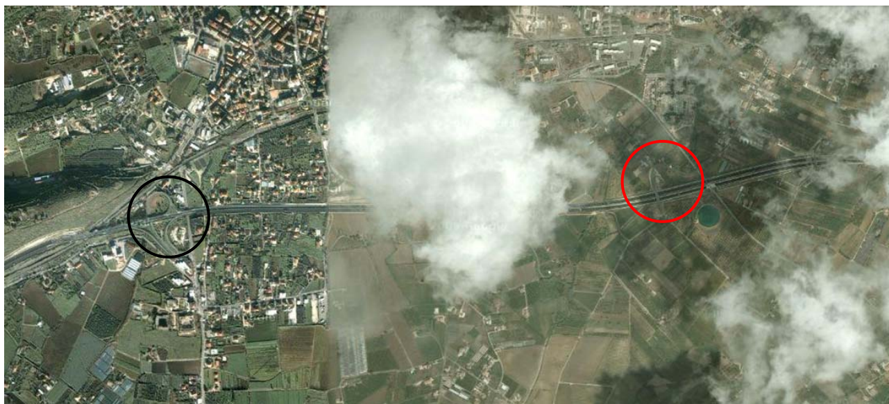
Figura 3 - In nero lo svincolo attuale, in rosso la localizzazione di progetto del Ptcp